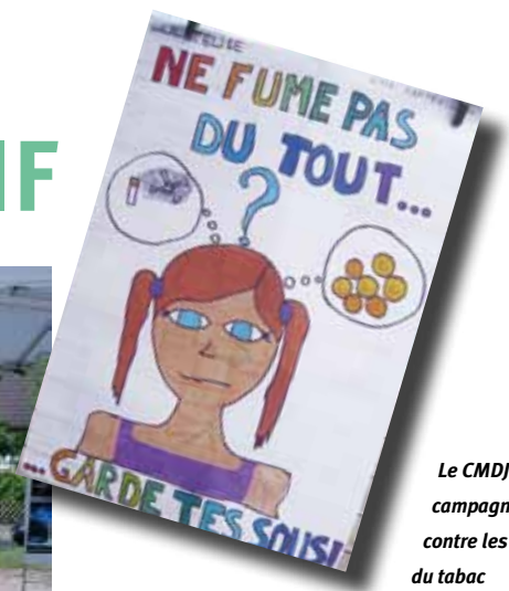
Le CMDJ en campagne active contre les méfaits du tabac