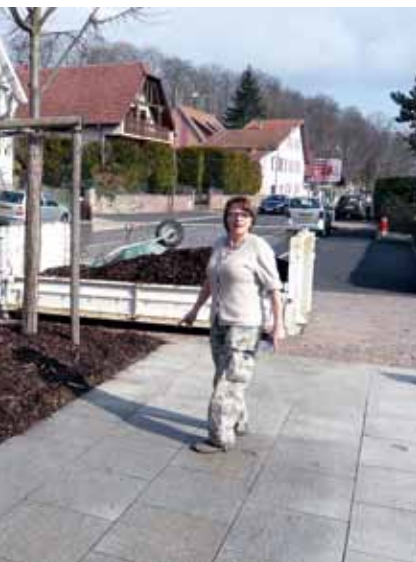
La touche finale apportée au réaménagement de la rue Principale : un relooking paysager original