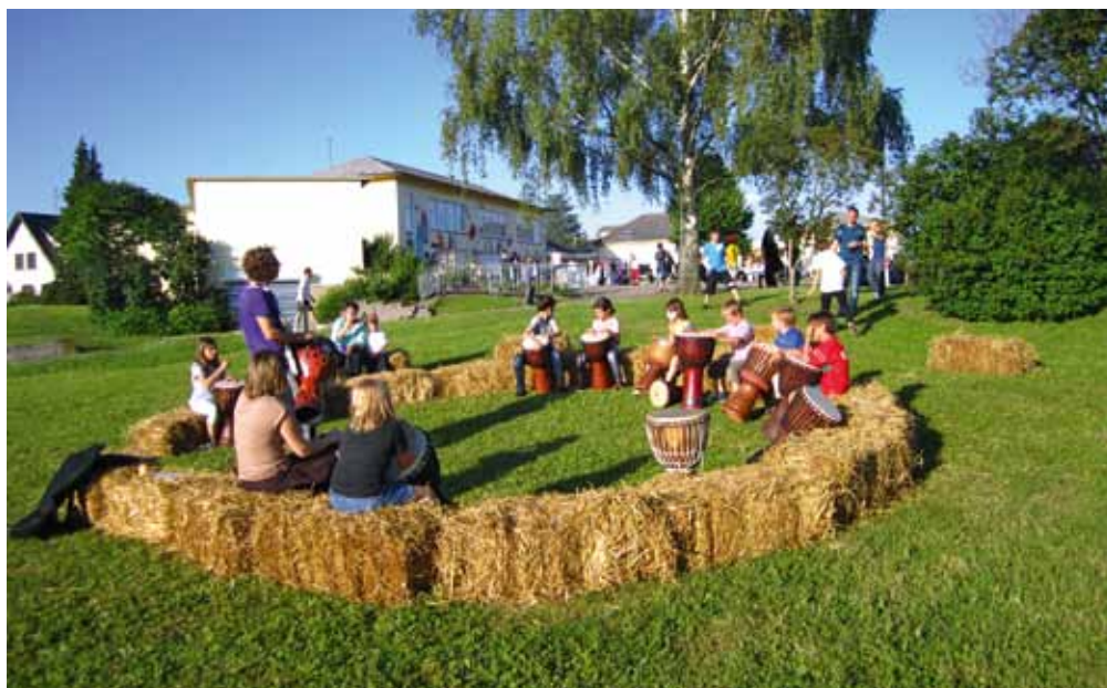
Le 15 juin dernier, l'Espace Jeunes a participé à la fête de l'école, en proposant une initiation aux percussions dans un esprit champêtre

Dans le cadre d'un projet organisé avec la FDMJC 67 et ULM Découverte, les jeunes ont pu s'envoler en paramoteur sur les hauteurs d'Epfig. 15 minutes de sensations fortes !