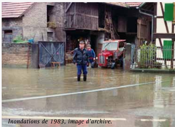
Inondations de 1983, image d'archive.