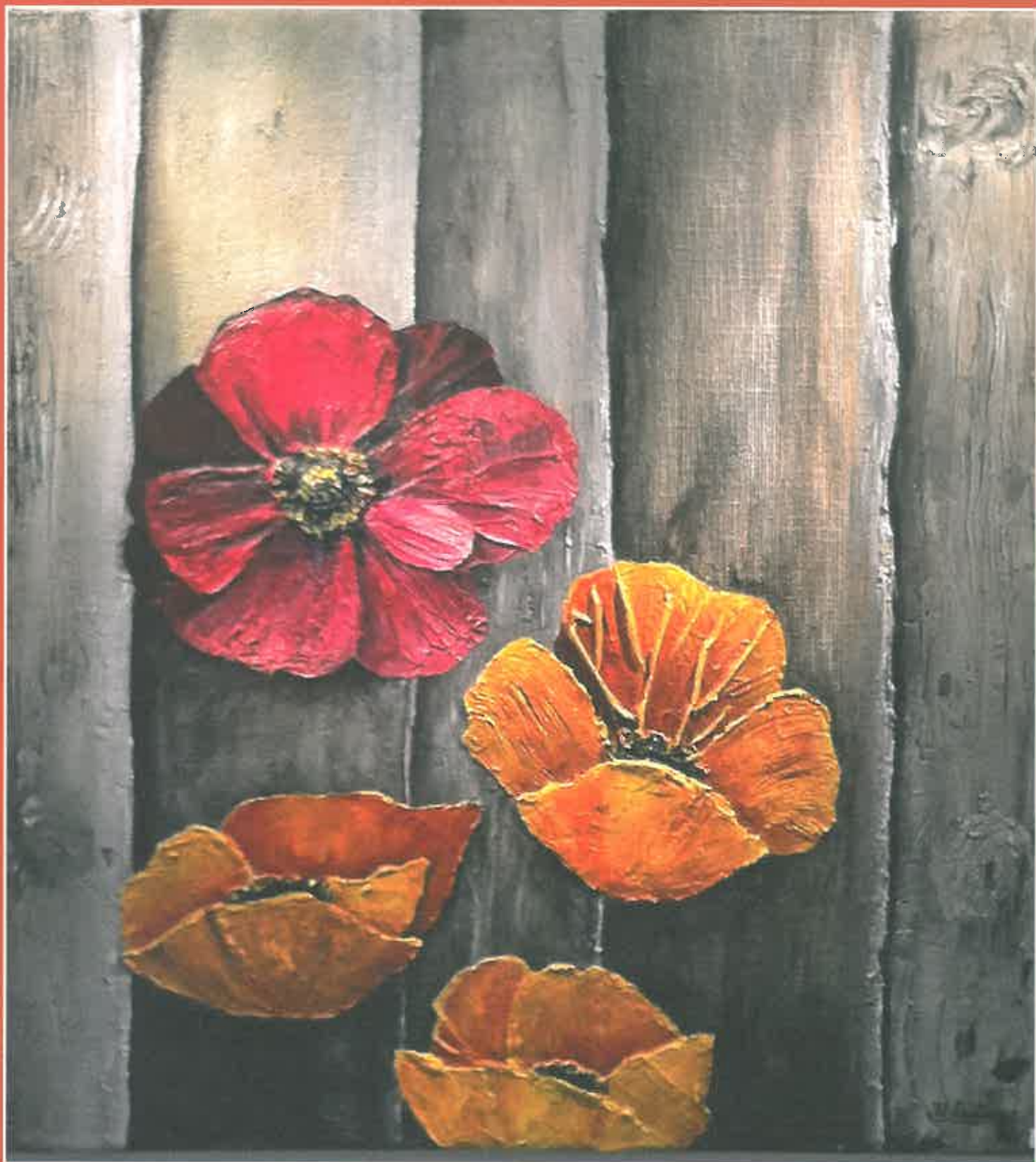
Détail du tableau réalisé par Mme Laffineur, qui a remporté le prix du public lors de l'exposition des artistes locaux au Messti de Lampertheim. Félicitation au peintre talentueux.