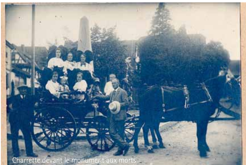
Charrette devant le monument aux morts