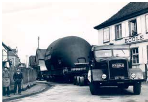
Gros engin rue de Mundolsheim