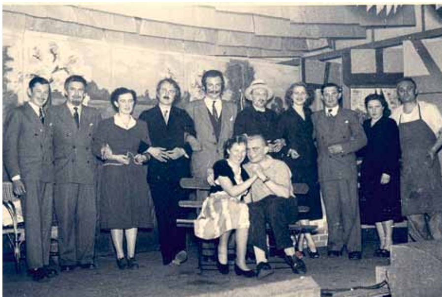
Soirée théâtre au Cheval Noir