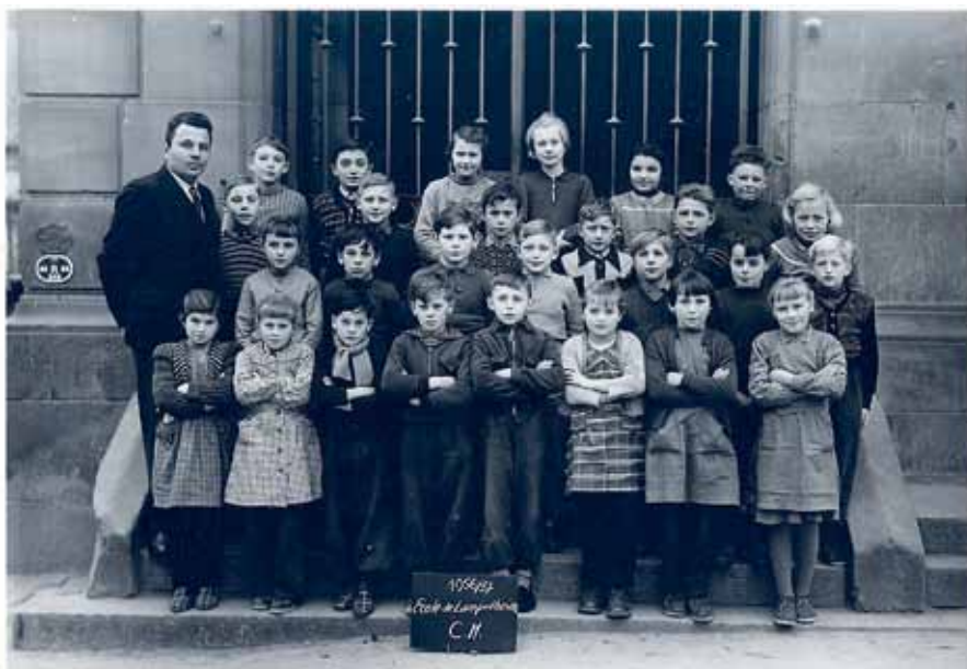
56-57 Cours Moyen

Nous publions ces images d'archives en vous lançant un appel afin de nous aider à mieux comprendre l'histoire de notre village et de ses habitants. Si vous reconnaissez des personnes, si vous avez des dates pour les clichés, merci de nous en avertir (mairie : 03 88 20 12 69, ou lampertheim@evc.net).