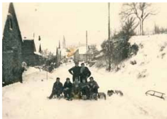
Partie de luge rue Leh